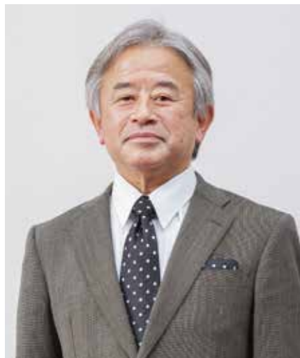
静岡福祉大学 学長