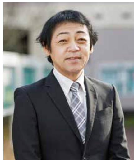
静岡福祉大学 社会福祉学部 学部長